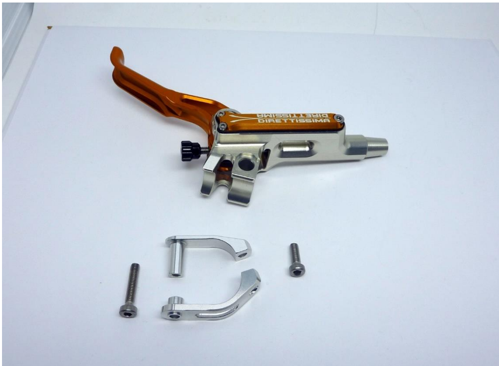
Abb.3: demontierte Frässchelle

Entfernen Sie die Schrauben mit einem 3mm Inbus aus der Frässchelle.