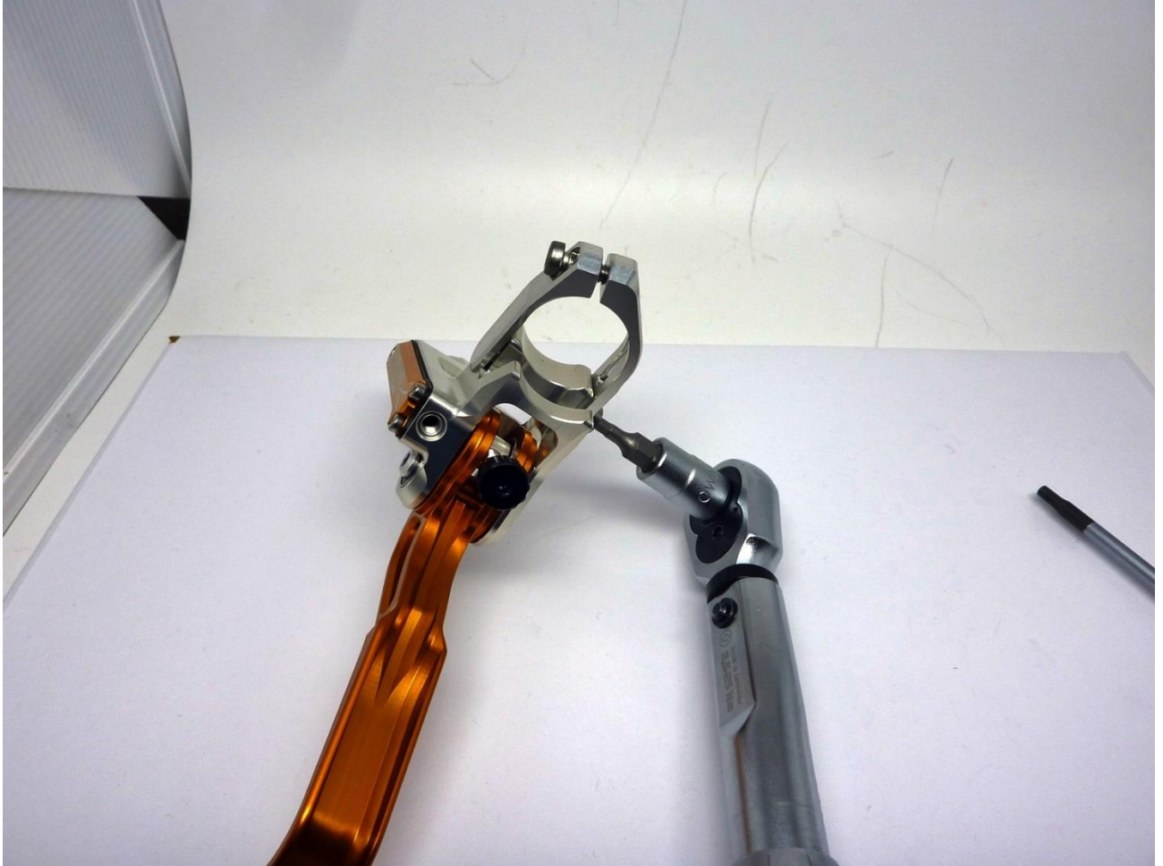
Abb. 6: DRT Pumpe mit Frässhelle, sowie Drehmomentschlüssel

Nach grober Vorausrichtung der Pumpe am Lenker, ist nun die untere Schraube mit einem Drehmoment von 2Nm anzuziehen (3mm Inbus).