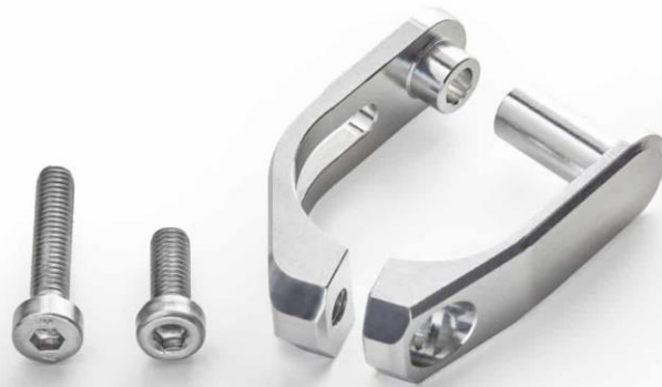
Abb.2: Frässchelle für eine Seite