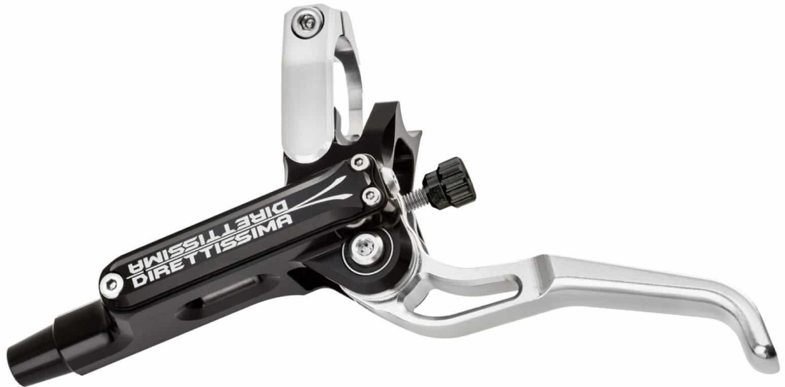
Abb.1: DRT Pumpe mit montierter Frässchelle

ACHTUNG: Arbeiten an sicherheitsrelevanten Bauteilen einer Scheibenbremse dürfen nur mit dem notwendigen Wissen und Fachkenntnis durchgeführt werden. Im Zweifel wenden Sie sich an Ihren Fachhändler oder an Trickstuff direkt.