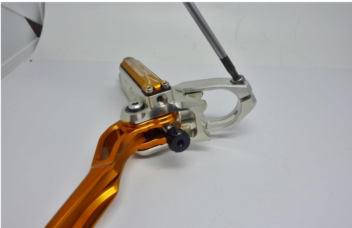
Abb. 7: DRT Pumpe mit Frässchelle, sowie 3mm Inbus

Die zweite Schraube der Frässchelle darf nur soweit angezogen werden, dass sich der Bremshebel mit normaler Handkraft verdrehen lässt (max. 1-1,5Nm). Dies gewährleistet im Sturzfall ein mögliches Verdrehen der Pumpe, um Schäden an dieser zu vermeiden. Des Weiteren ist auf die max. Drehmomentangabe des Lenkerherstellers zu achten!