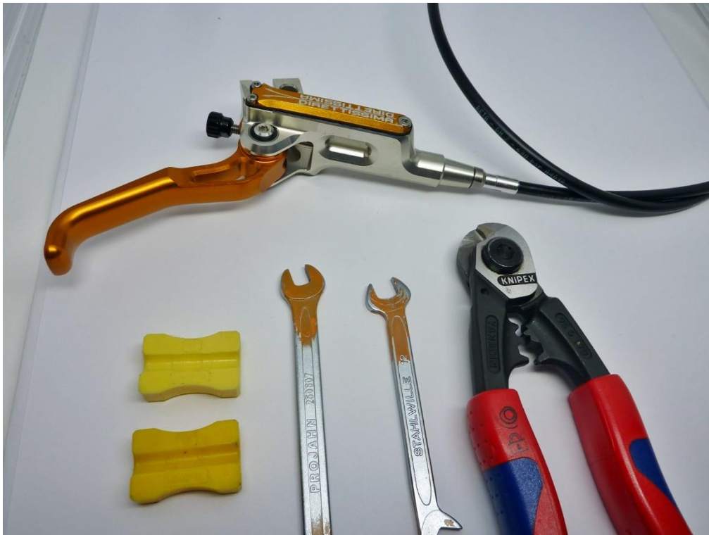
Abb.1: Werkzeug und Direttissima Bremspumpe